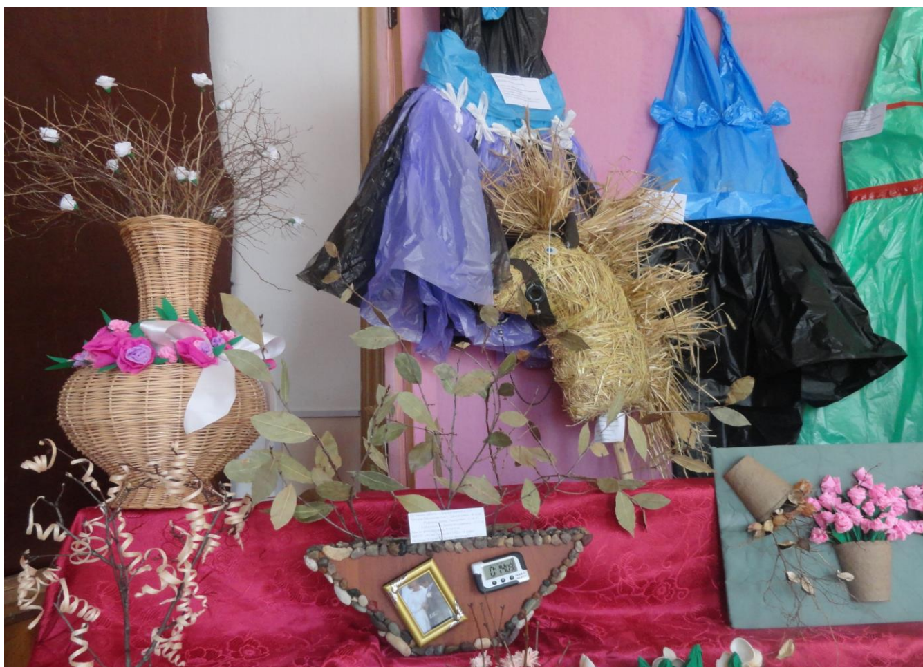
Оргкомитет по проведению Акции.