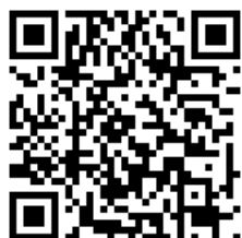
График проведения консультаций: